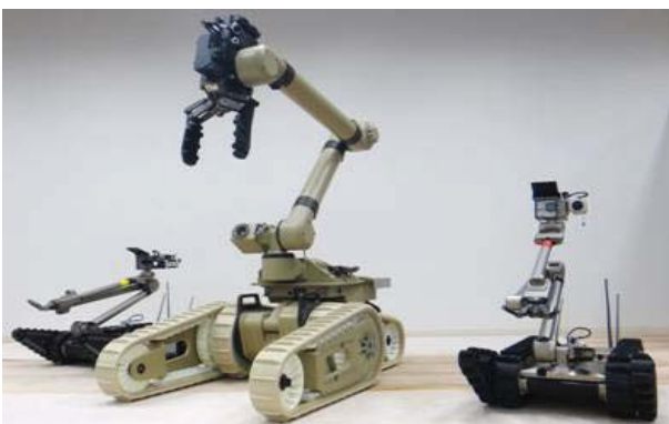
中央: Warrior 左右: PackBot® (iRobot®社製)

PackBot®の運転・操作(走行, 階段昇降, 物品挿取) 実施回数 31回 参加人数 約210名(12社計)