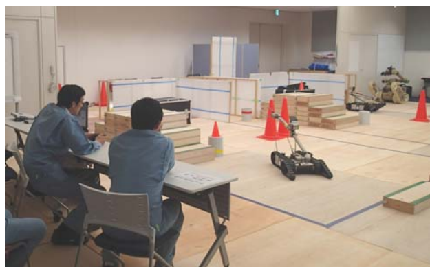
原子力緊急事態支援センターでの操作訓練の様子