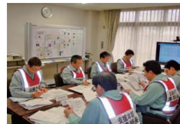
敦賀発電所災害対策本部支援訓練(敦賀市内)

・敦賀市内で、要員の派遣、資機材の調達・運搬、メーカー支援対応等、発電所への支援を行います。