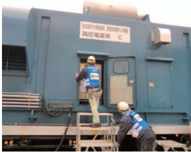
高圧電源車の起動訓練(配備場所)