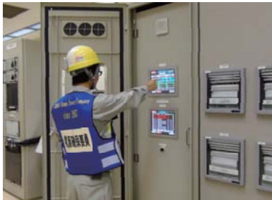
高圧電源車遠隔起動訓練(中央制御室)