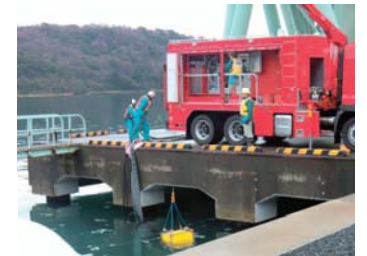
送水ポンプ吊降ろし訓練(岸壁)