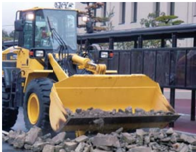
ホイールローダによる障害物の撤去訓練