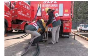
送水ポンプへのホース接続訓練