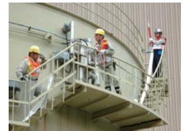
タンクへの注水訓練