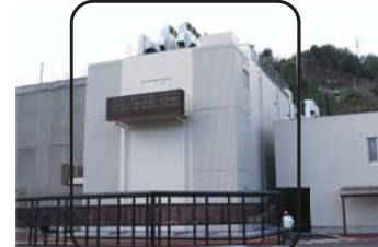
免震構造で、放射線防護対策を講じた緊急時対策室建屋