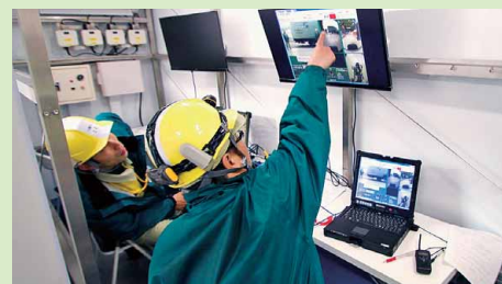
コントロール車で支援ロボットからの映像を確認