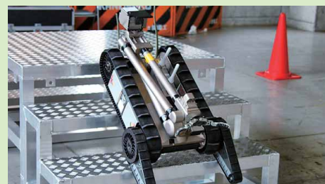
階段を昇降する訓練