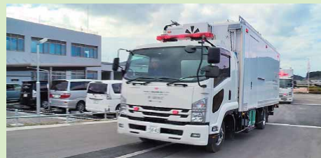
発電所の要請を受け、美浜原子力緊急事態支援センターを出発するコントロール車

今回の原子力総合防災訓練では、平成28年12月に本格運用を開始した「美浜原子力緊急事態支援センター」に要員の派遣、支援ロボットの搬送を要請し、発電所構内において支援ロボットによる現場の情報収集訓練を行いました。