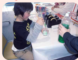
スライム作りの様子