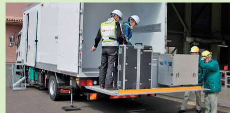
発電所に到着したコントロール車から支援ロボット等の資機材の搬出