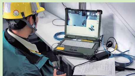
遠隔操作による支援ロボットの操作訓練