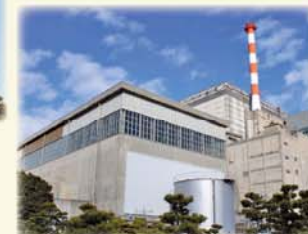
東海発電所 (廃止措置中)

日本原子力発電株式会社 The Japan Atomic Power Company