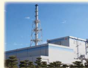
東海第二発電所 (安全性向上対策工事中)