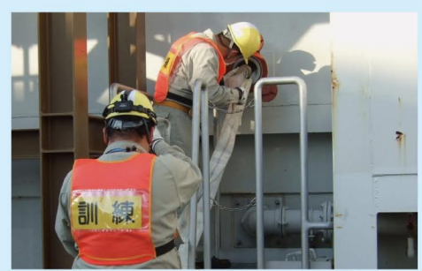
④ 原子炉建屋の接続口にホースを接続し、注水できることを確認