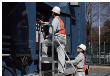
高圧電源車の起動