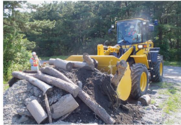
ホイールローダの運転