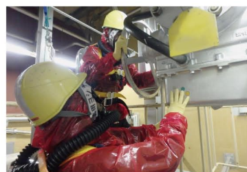
防護装備を装着しての操作確認