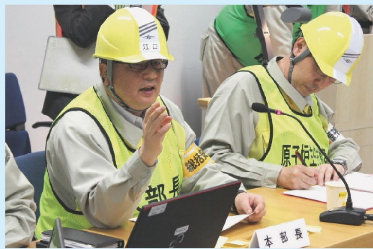
災害対策本部長（発電所長）