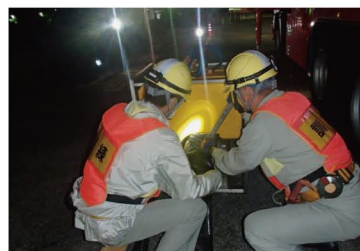
ポンプにホースを接続し、送水経路を確保（夜間訓練）