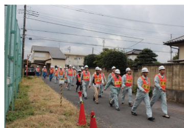
津波発生を想定した高所への避難訓練