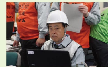
総合災害対策本部長（社長）