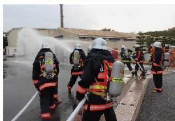
自衛消防隊による消火訓練