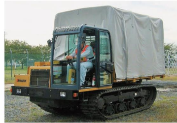
クローラ（悪路走行車）の運転