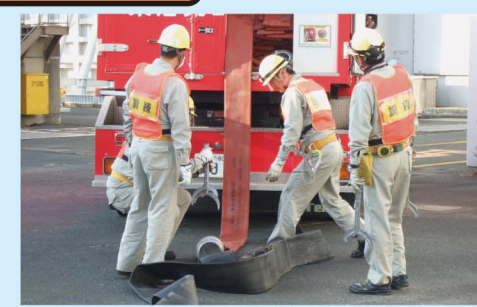
③ ホース延長車により、原子炉建屋の接続口までの送水経路を確保