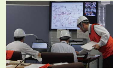
発電所状況や本部の状況 について国と情報共有