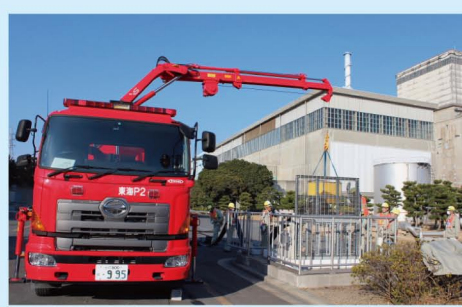
① 冷却水を汲み上げるため、大容量ポンプ車を水源近くに配備