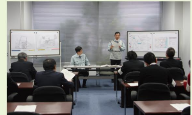
模擬記者を相手に 発電所状況を公表