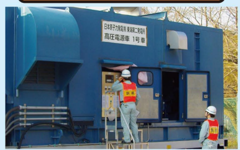
高圧電源車を起動し、発電所に電気を供給できることを確認