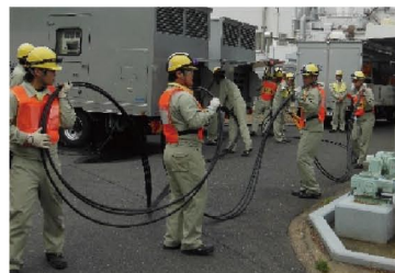
低圧電源車にケーブルを接続し、現場の電源盤に電気を供給