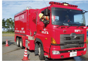
大容量ポンプ車の運転