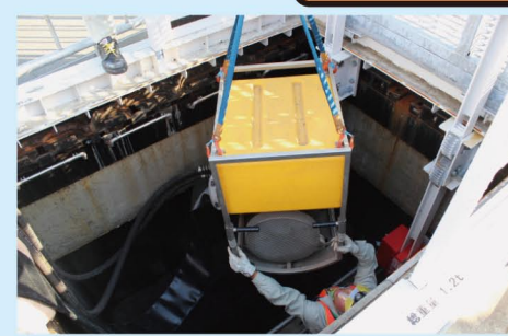
② ポンプを使って水源から冷却水の汲み上げを実施