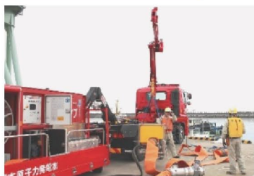
注水に必要な水の汲み上げ