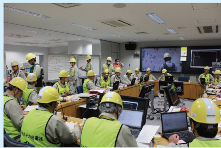
災害対策本部の様子

災害対策本部長（発電所長）を中心とした災害対策本部が、 発電所の状況等を迅速かつ的確に判断し、対応を指示