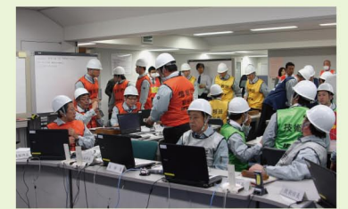
総合災害対策本部の様子